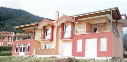
Resim 1: PVC pencere profil uygulaması örneği, Yalova.